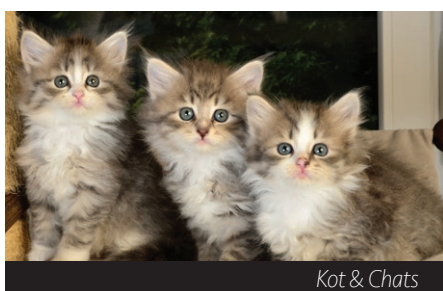
Kot & Chats

l'âge, la taille, la sensibilité ou encore l'activité de ceux-ci. C'est pourquoi nous utilisons des protéines différentes telles que l'agneau pour la digestion, le poisson pour la peau et le pelage ou encore le canard, la dinde et le poulet. Chacune de nos croquettes contient, en outre, de la glucosamine et de la chondroïtine qui contribuent à éviter les problèmes articulaires et favorisent le bon développement des cartilages. Nous avons également conçu une gamme de biscuits sans céréales pour chiens qui compte trois goûts différents ainsi que l'arrivée imminente des sticks destinés à l'hygiène dentaire. Les chats ne sont pas oubliés et nous leur réservons une surprise très prochainement ».